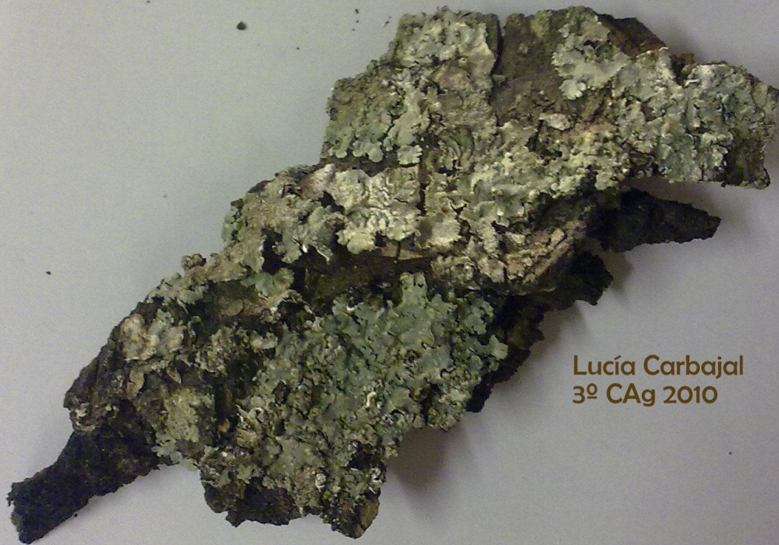
Lucía Carbajal 3º CAg 2010