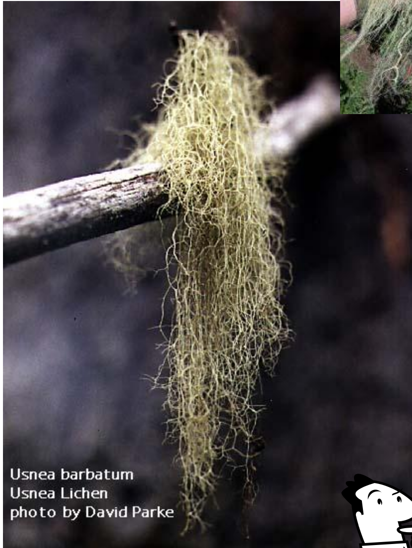
Usnea barbata Usnea Lichen