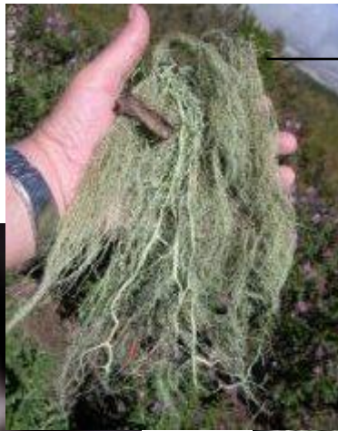
Usnea articulata (argentina)