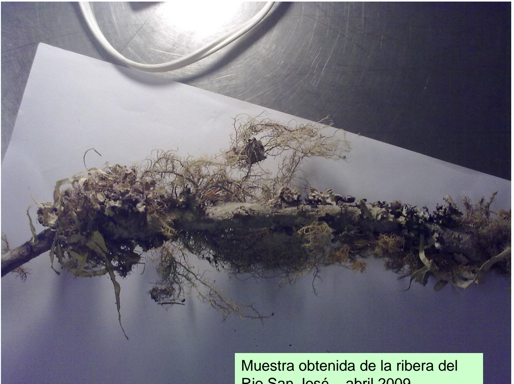
Muestra obtenida de la ribera del Rio San José – abril 2009 –