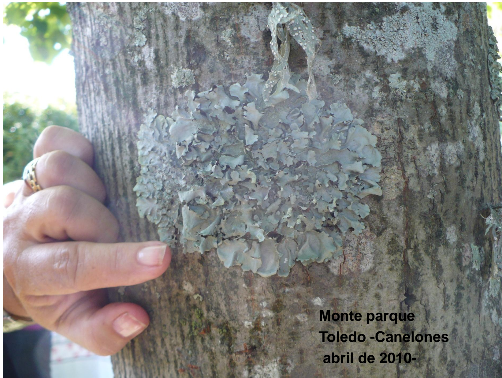
Monte parque Toledo -Canelones abril de 2010-