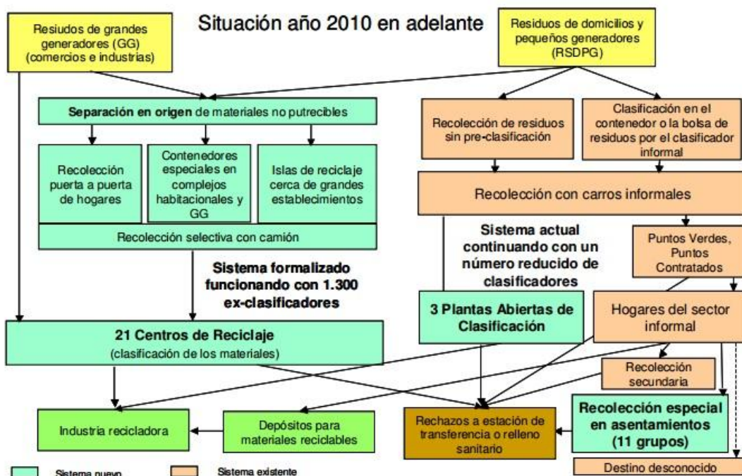
Figura 3-4: Futuro sistema de recolección y clasificación de materiales reciclables